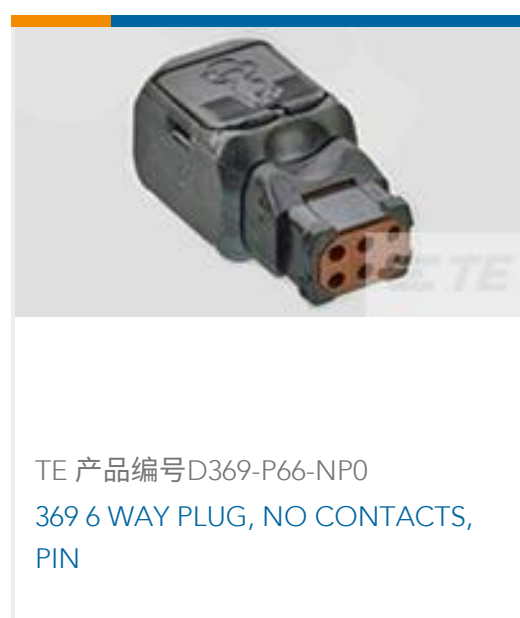
TE 产品编号D369-P66-NP0 369 6 WAY PLUG, NO CONTACTS, PIN