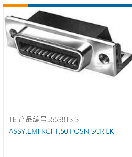
TE 产品编号5553813-3 ASSY,EMI RCPT,50 POSN,SCR LK