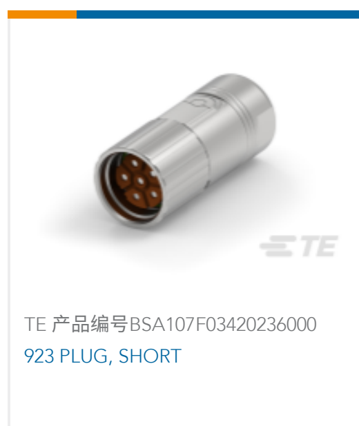
TE 产品编号BSA107F03420236000 923 PLUG, SHORT