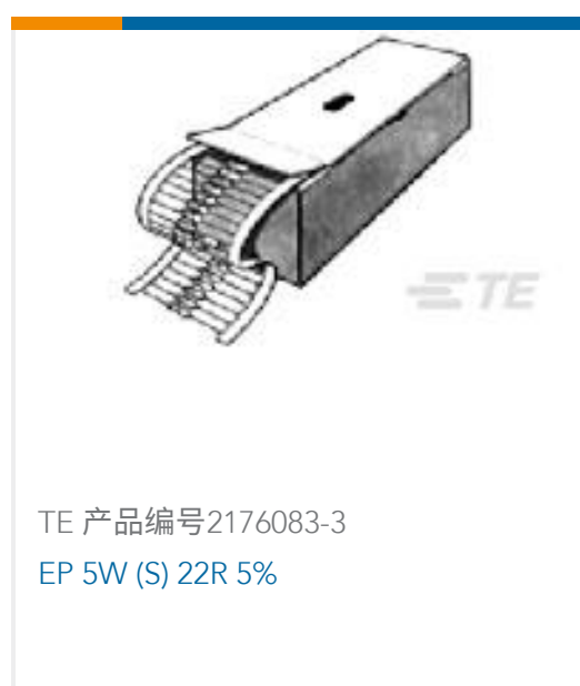
TE 产品编号2176083-3 EP 5W (S) 22R 5%