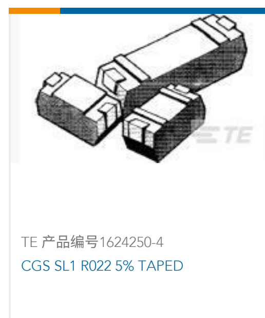
TE 产品编号1624250-4 CGS SL1 R022 5% TAPED