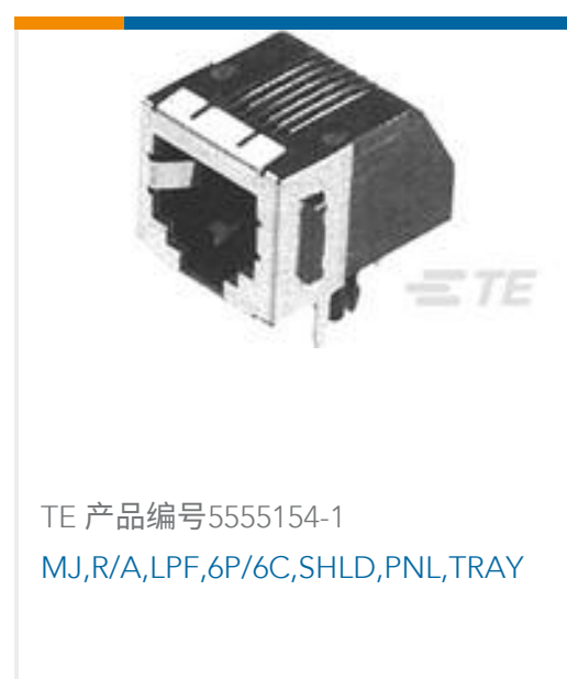
TE 产品编号5555154-1 MJ,R/A,LPF,6P/6C,SHLD,PNL,TRAY