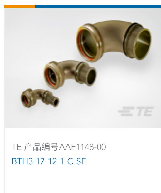
TE 产品编号AAF1148-00 BTH3-17-12-1-C-SE