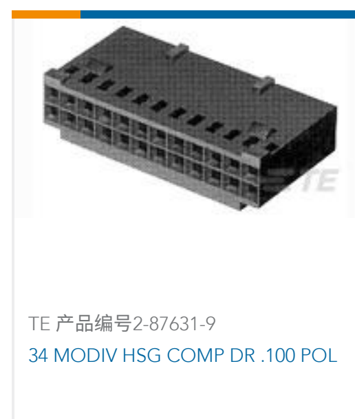
TE 产品编号2-87631-9 34 MODIV HSG COMP DR .100 POL