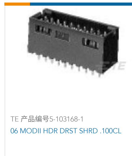
TE 产品编号5-103168-1 06 MODII HDR DRST SHRD .100CL