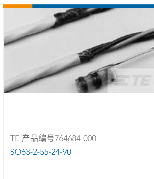
TE 产品编号764684-000 SO63-2-55-24-90