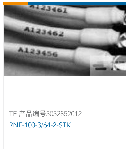
TE 产品编号5052852012 RNF-100-3/64-2-STK