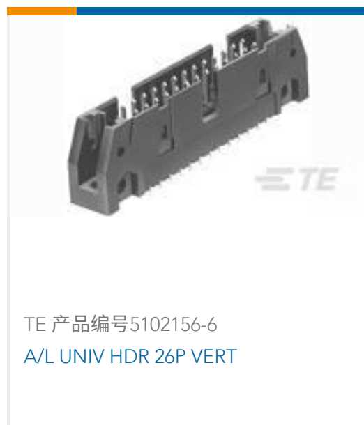
TE 产品编号5102156-6 A/L UNIV HDR 26P VERT