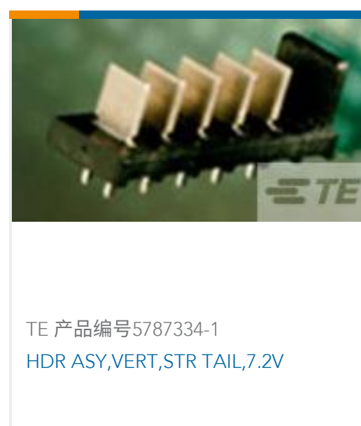
TE 产品编号5787334-1 HDR ASY,VERT,STR TAIL,7.2V