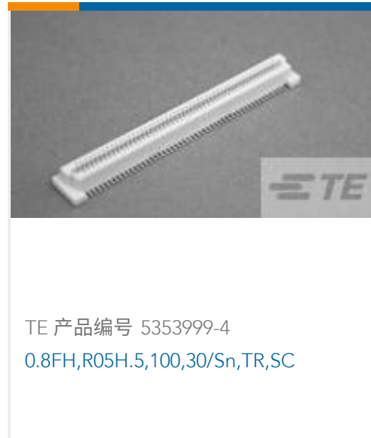
TE 产品编号 5353999-4 0.8FH,R05H.5,100,30/Sn,TR,SC