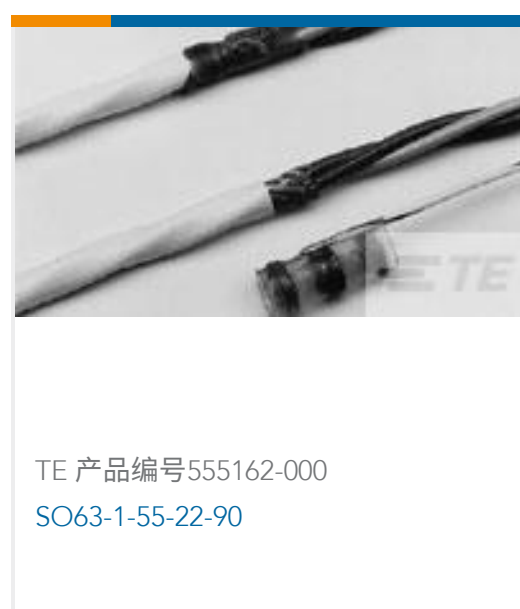
TE 产品编号555162-000 SO63-1-55-22-90