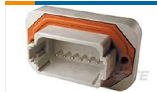
TE 产品编号DT15-12PA HDR, 12P, GRY, ST, NI/CU, A