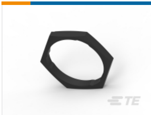
TE 产品编号2411-001-2405 PANEL NUT, SIZE 24, HDP