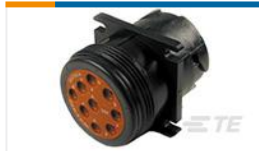
TE 产品编号HD10-9-1939P SQ FG REC ASM