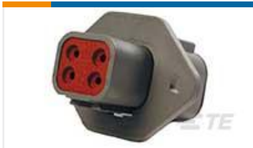
TE 产品编号DTP04-4P-L012 REC, 4P, GRY, N, FLANGE