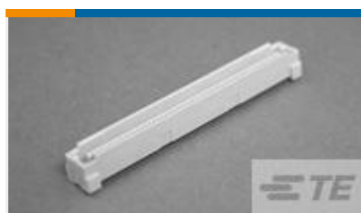
TE 产品编号 5179029-1 0.8FH,P06H.5,040,08/Sn,TU