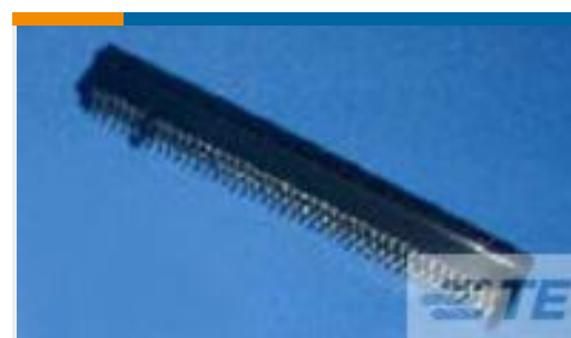
TE 产品编号8-1734774-4 PCI EXP 2.3L 98 POS BLK G/F