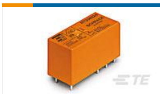
TE 产品编号2-1415898-4 RTS3LA24