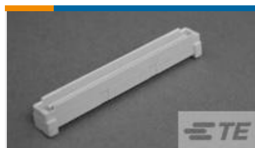
TE 产品编号2-5177986-2 0.8FH,P07H.5,060,08/Sn,TR,SC