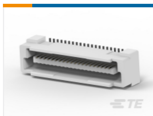
TE 产品编号 CAT-313-PCB40 自由高度插头连接器：板对板，垂直，40，0.8mm