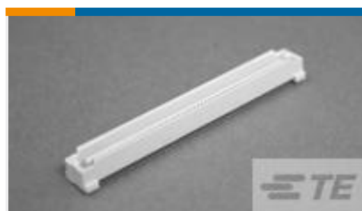
TE 产品编号5177986-3 0.8FH,P05H.5,080,08/Sn,TR,SC