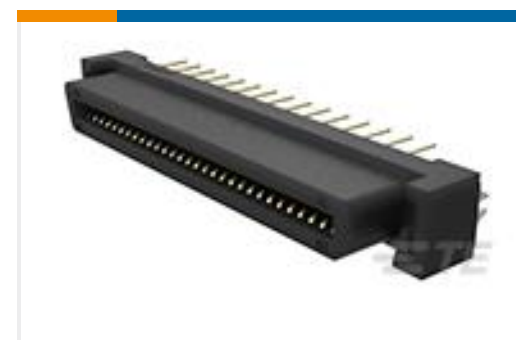
TE 产品编号3-5175475-8 CHAMP 050 B/B REC V W/LEG 68P