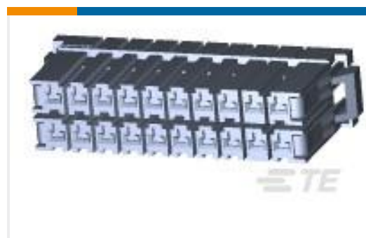
TE 产品编号1-917659-8 DYNAMIC 3200 REC HSG 20P