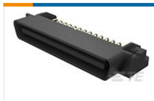
TE 产品编号1734099-7 Champ 050 series, plug assembly