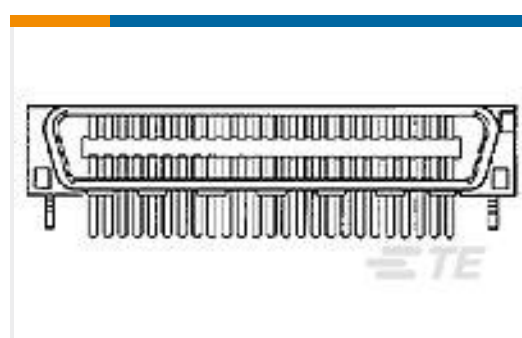
TE 产品编号3-5179275-8 CHAMP 050-I PLUG H ASSY 68P