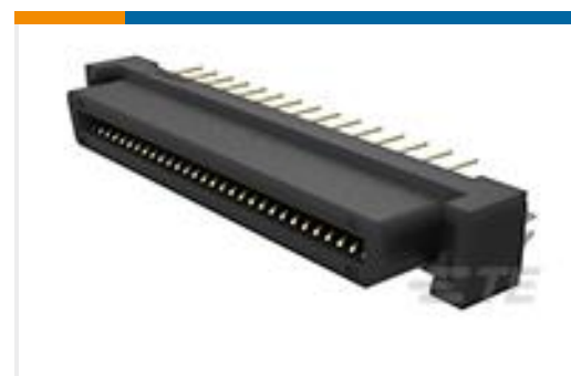
TE 产品编号1734101-7 Champ050 series, 68pos, Au over PdNi