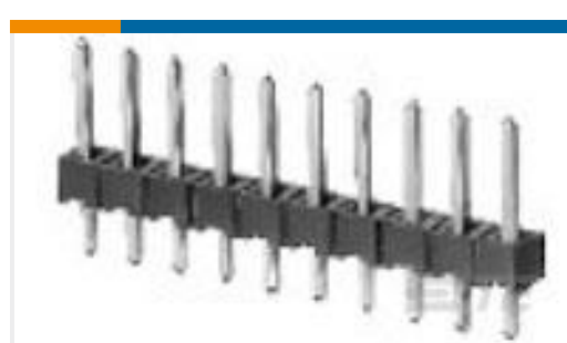
TE 产品编号5-146274-3 03 MODII HDR SRST B/A .100CL