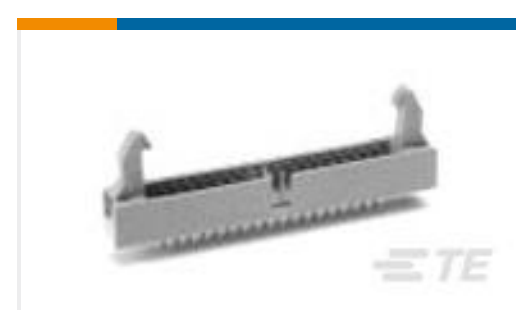
TE 产品编号1-1761685-5 IDC LOW PRO HDR 50P VERT SHT LAT