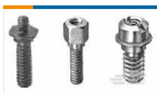
TE 产品编号786585-2 50SR SCREWLOCK KIT,FEMALE