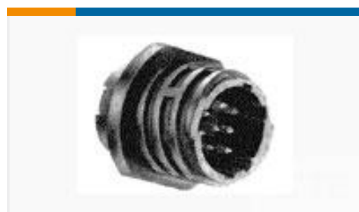
TE 产品编号206486-2 CPC RECPT ASSEMBLY SIZE 11-9