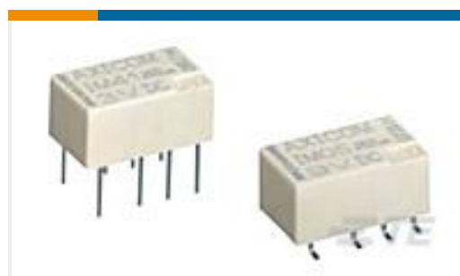
TE 产品编号1-1462037-6 IM03JR=IM RELAY 140mW 5V