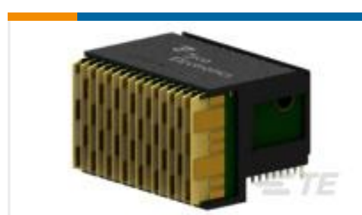
TE 产品编号1410187-4 MULTIGIG RT T2 7RW DC DF CT