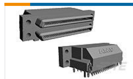
TE 产品编号5787962-1 .8MM CHAMP STACK RCPT ASSY