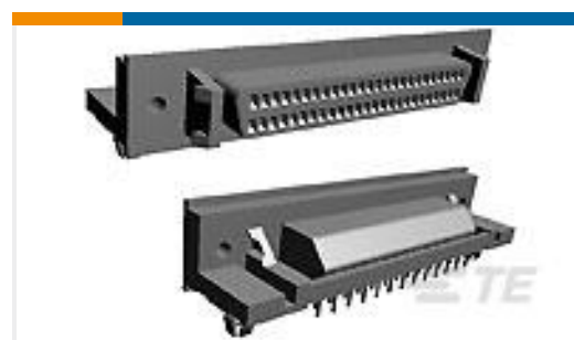
TE 产品编号5787082-7 68 50SR R/A RCPT ASSY,RDSN L/F