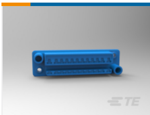
TE 产品编号 CAT-AM7017-SD292P Standard Drawer Plug Housings