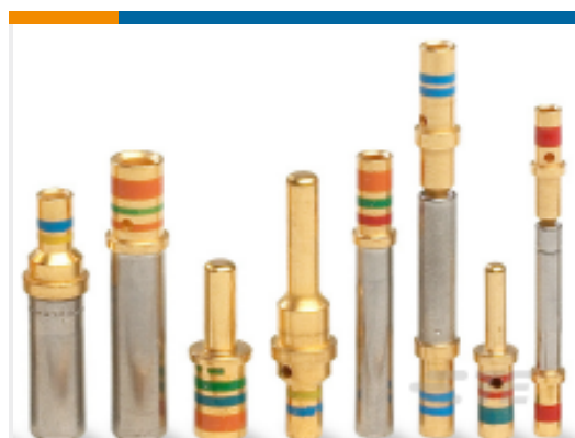
TE 产品编号2562-209-2031 CONT SOC ASSY