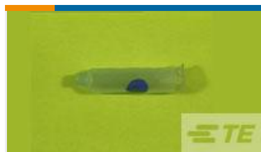
TE 产品编号617867-000 D-436-0186