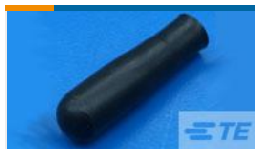
TE 产品编号610015-000 D-300-02