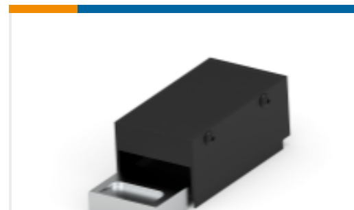
TE 产品编号2215078-1 ASSY, STG TL, CFP2, 1X1 W HS