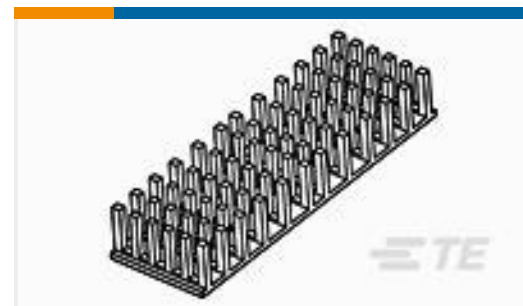
TE 产品编号1963850-2 XFP. MSA HEATSINK 10mm TALL