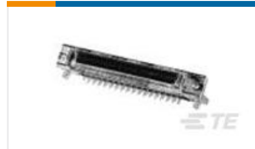
TE 产品编号5787266-5 50 50SR R/A RCPT ASSY,RDSN L/F