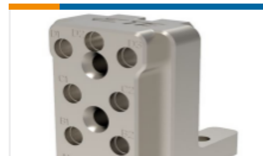
TE 产品编号2357976-1 ASSEMBLY, RF MODULE, DAUGHTERCARD