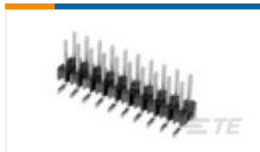
TE 产品编号6-146130-2 26 MODII HDR DRST SFMNT B/A LF