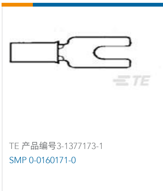
TE 产品编号 3-1377173-1 SMP 0-0160171-0