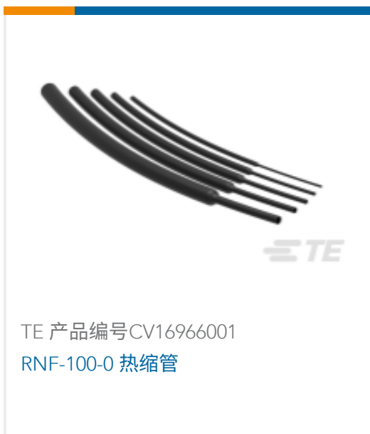
TE 产品编号 CV16966001 RNF-100-0 热缩管