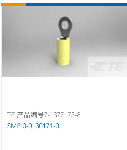
TE 产品编号 7-1377173-8 SMP 0-0130171-0