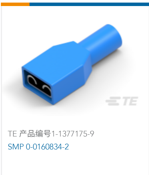
TE 产品编号 1-1377175-9 SMP 0-0160834-2