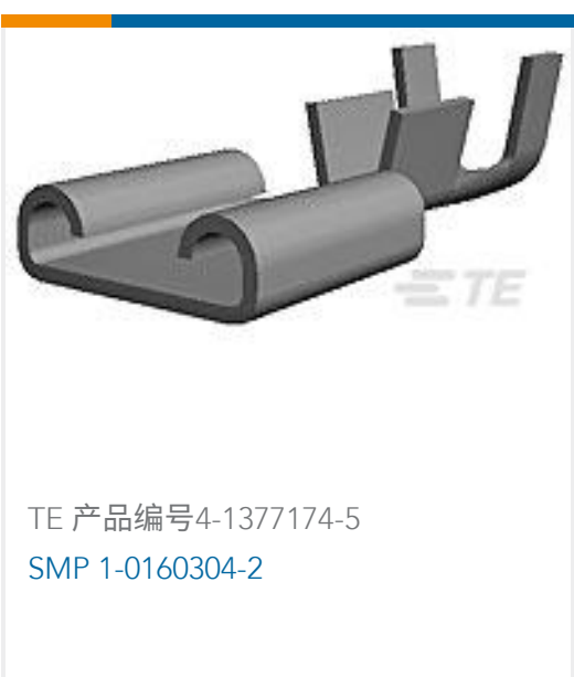
TE 产品编号 4-1377174-5 SMP 1-0160304-2