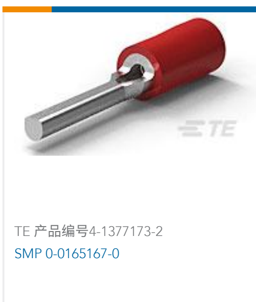
TE 产品编号 4-1377173-2 SMP 0-0165167-0