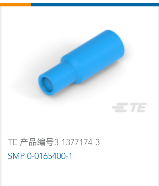
TE 产品编号 3-1377174-3 SMP 0-0165400-1