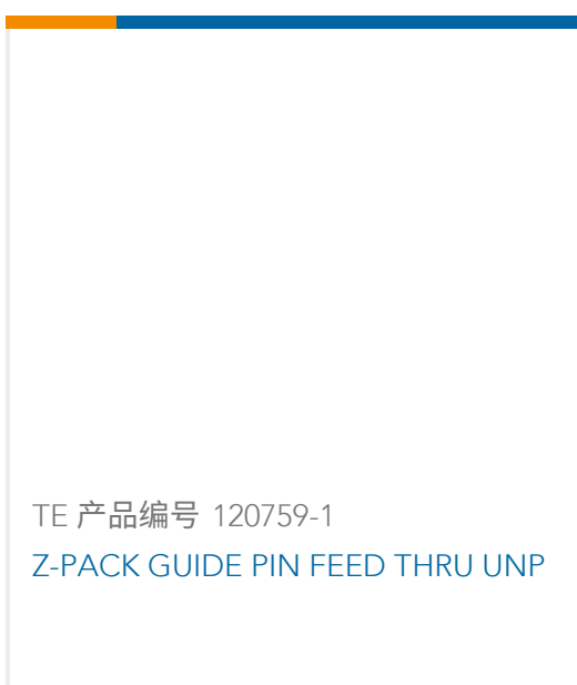
TE 产品编号 120759-1 Z-PACK GUIDE PIN FEED THRU UNP