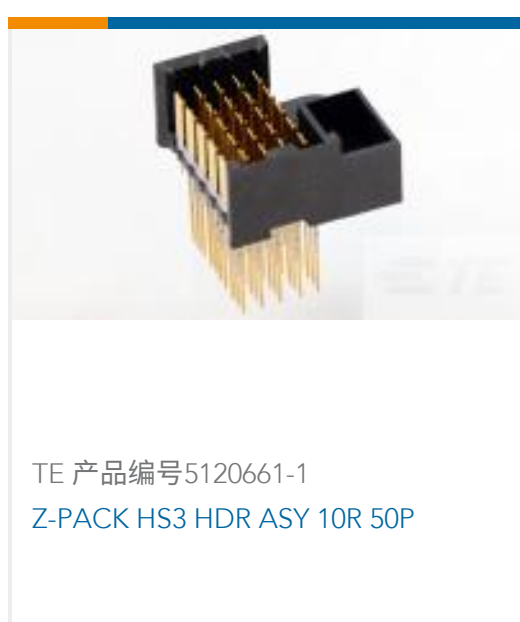
TE 产品编号5120661-1 Z-PACK HS3 HDR ASY 10R 50P