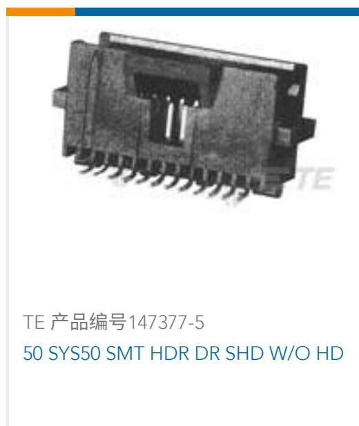
TE 产品编号147377-5 50 SYS50 SMT HDR DR SHD W/O HD