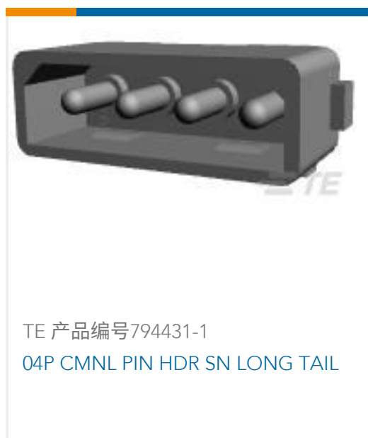
TE 产品编号794431-1 04P CMNL PIN HDR SN LONG TAIL