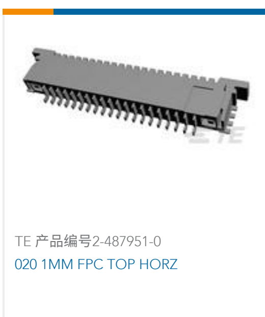
TE 产品编号2-487951-0 020 1MM FPC TOP HORZ