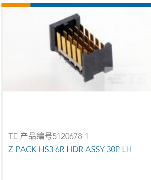
TE 产品编号5120678-1 Z-PACK HS3 6R HDR ASSY 30P LH