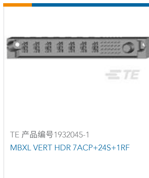
TE 产品编号1932045-1 MBXL VERT HDR 7ACP+24S+1RF