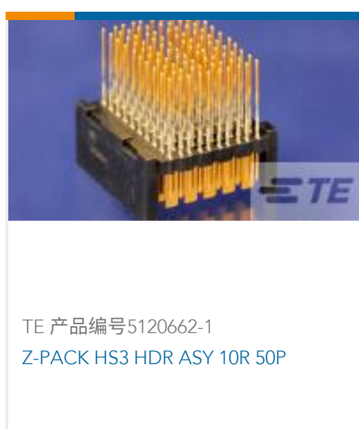
TE 产品编号5120662-1 Z-PACK HS3 HDR ASY 10R 50P