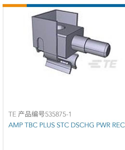
TE 产品编号535875-1 AMP TBC PLUS STC DSCHG PWR REC