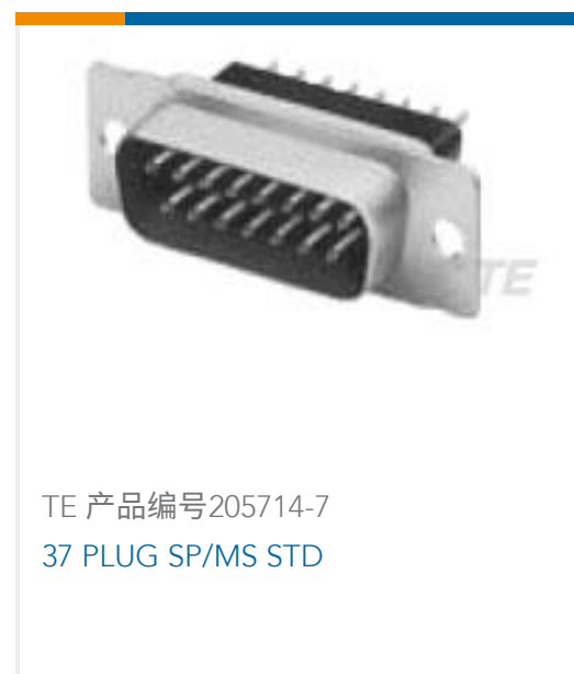
TE 产品编号205714-7 37 PLUG SP/MS STD