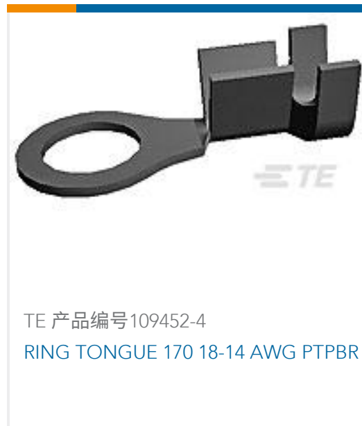
TE 产品编号109452-4 RING TONGUE 170 18-14 AWG PTPBR