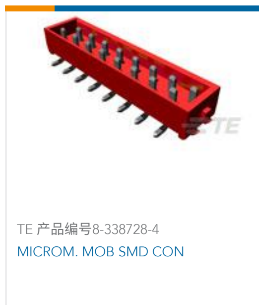
TE 产品编号8-338728-4 MICROM. MOB SMD CON