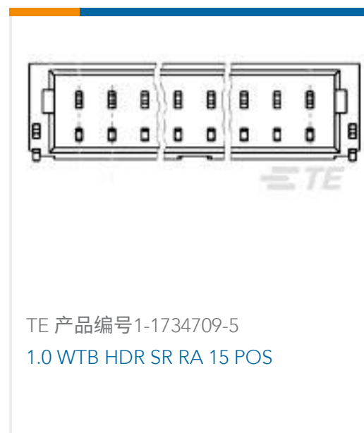
TE 产品编号1-1734709-5 1.0 WTB HDR SR RA 15 POS