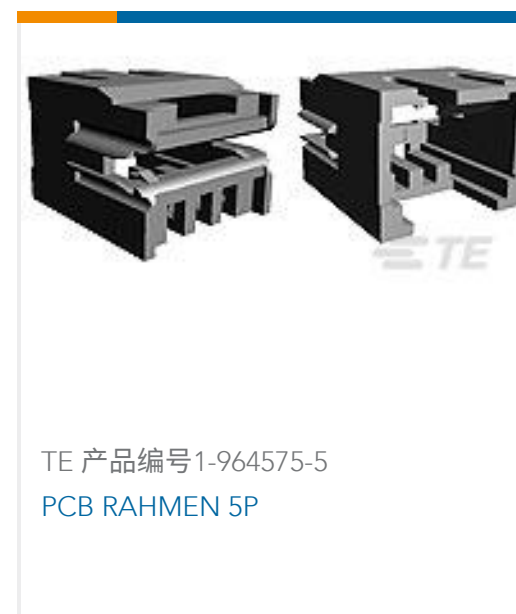
TE 产品编号1-964575-5 PCB RAHMEN 5P