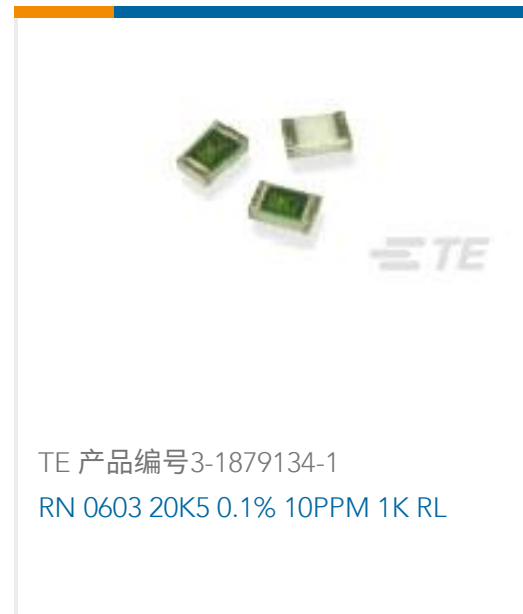
TE 产品编号3-1879134-1 RN 0603 20K5 0.1% 10PPM 1K RL