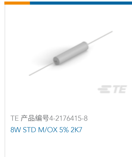
TE 产品编号4-2176415-8 8W STD M/OX 5% 2K7