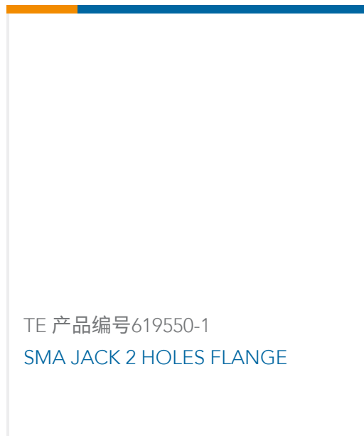
TE 产品编号619550-1 SMA JACK 2 HOLES FLANGE