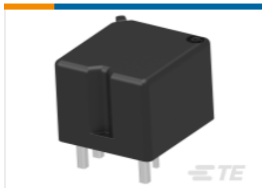
TE 产品编号1-1393280-1 V23086C1002A403