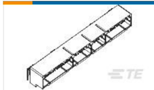
TE 产品编号178780-3 040/070 HYBRID 76POS CAP ASSY H TIN