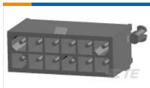
TE 产品编号1-794066-0 12P MINI UMNL HDR W/DH SN LF