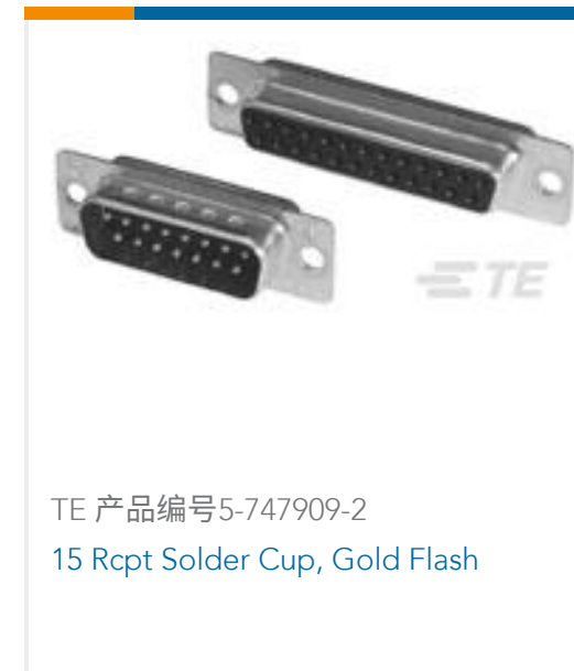
TE 产品编号5-747909-2 15 Rcpt Solder Cup, Gold Flash