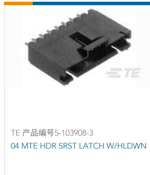
TE 产品编号5-103908-3 04 MTE HDR SRST LATCH W/HLDWN