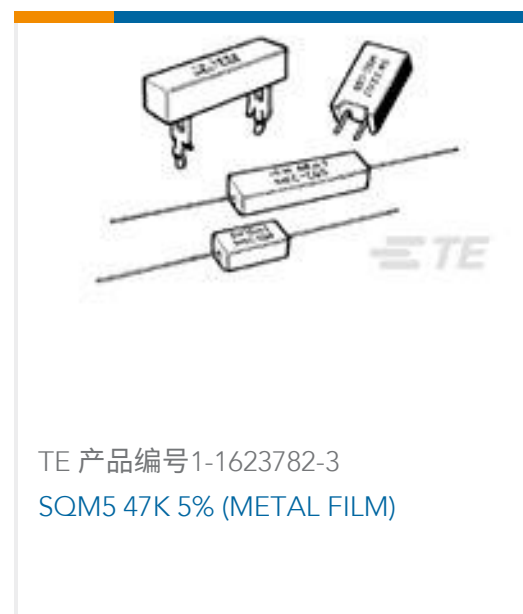
TE 产品编号1-1623782-3 SQM5 47K 5% (METAL FILM)