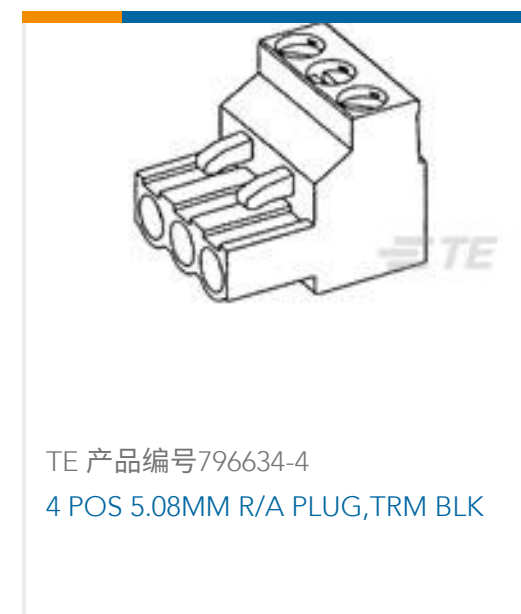
TE 产品编号796634-4 4 POS 5.08MM R/A PLUG, TRM BLK