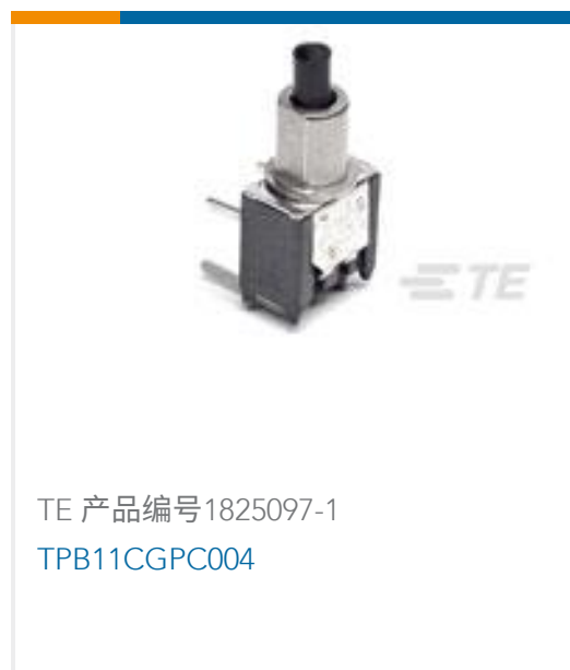
TE 产品编号1825097-1 TPB11CGPC004