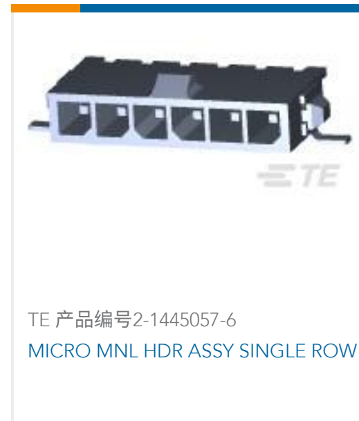
TE 产品编号2-1445057-6 MICRO MNL HDR ASSY SINGLE ROW