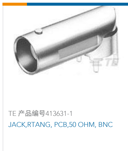
TE 产品编号413631-1 JACK,RTANG, PCB,50 OHM, BNC