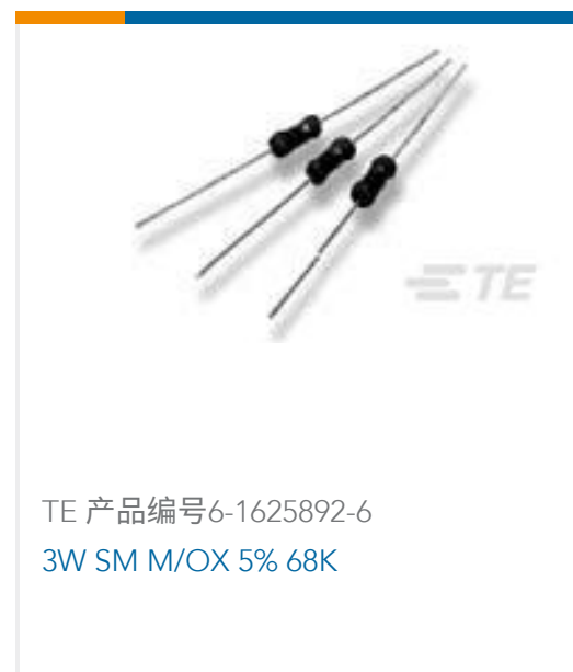
TE 产品编号6-1625892-6 3W SM M/OX 5% 68K