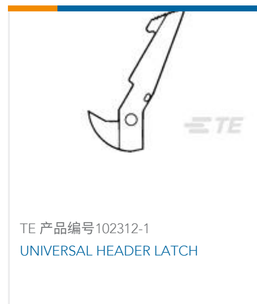
TE 产品编号102312-1 UNIVERSAL HEADER LATCH