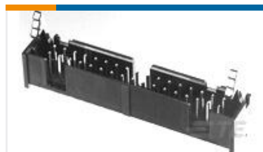
TE 产品编号2-1761606-9 IDC LOW PRO HDR 26P VERT LG LA