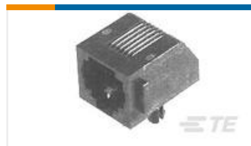
TE 产品编号5555164-1 MJ,LPF,R/A,8P,TRAY