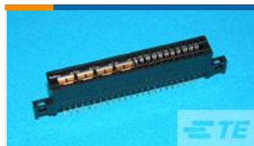
TE 产品编号5645169-3 CONN SEC II 49 POS 100C/L