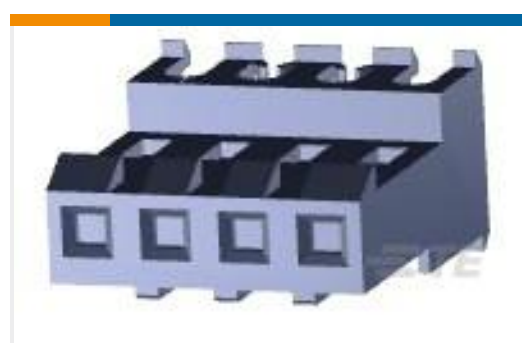
TE 产品编号3-640601-4 04P MTA156 CONN ASSY 22AWG LF