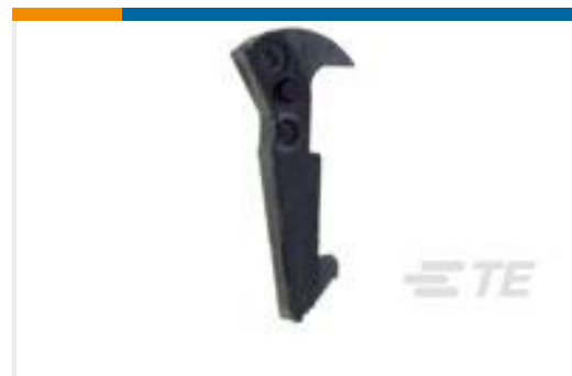
TE 产品编号102320-1 UNIVERSAL HEADER LATCH