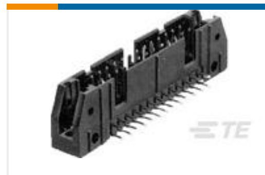
TE 产品编号5102159-6 A/L UNIV HDR 26P RA