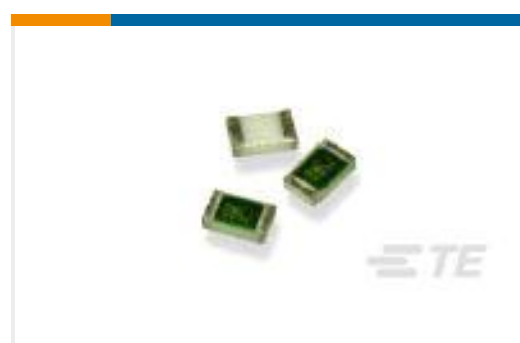
TE 产品编号1-1614959-1 CPF0805 1M5 0.1% 25PPM 1K RL