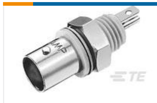
TE 产品编号5227726-2 ISOLATED BNC SOLDER JACK ASSY