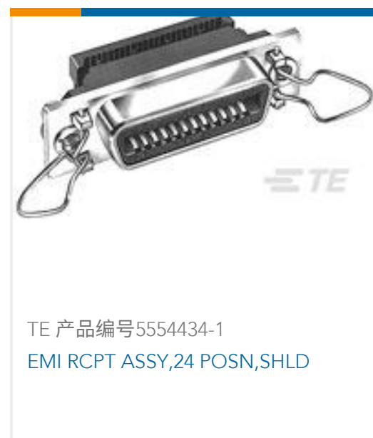
TE 产品编号5554434-1 EMI RCPT ASSY,24 POSN,SHLD