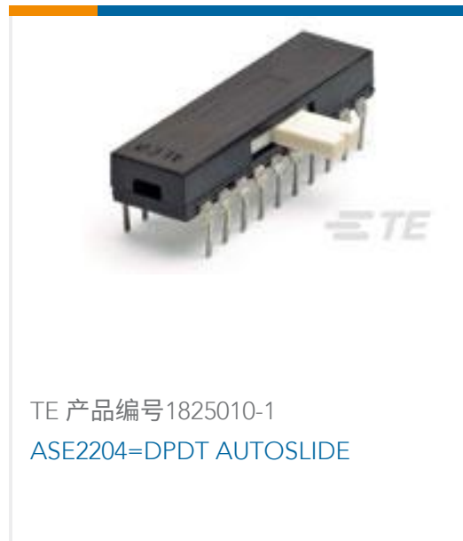
TE 产品编号1825010-1 ASE2204=DPDT AUTOSLIDE