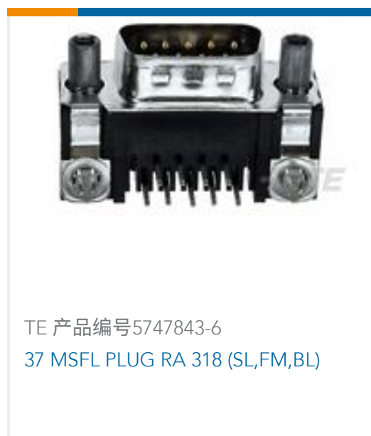
TE 产品编号5747843-6 37 MSFL PLUG RA 318 (SL,FM,BL)