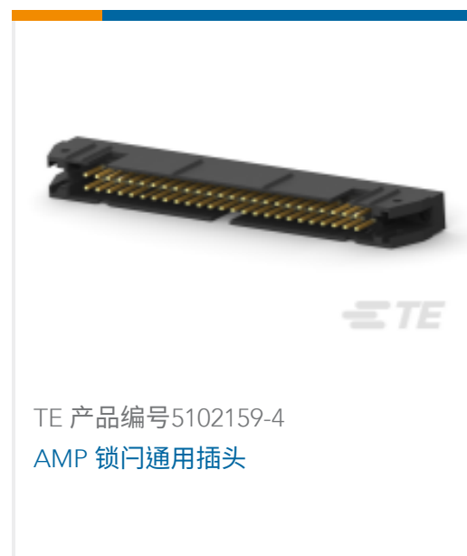
TE 产品编号5102159-4 AMP 锁门通用插头