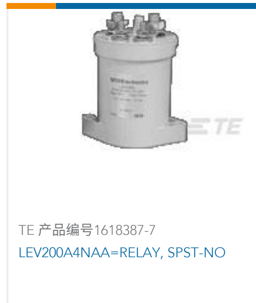
TE 产品编号1618387-7 LEV200A4NAA=RELAY, SPST-NO