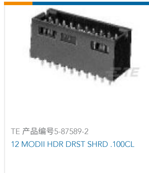
TE 产品编号5-87589-2 12 MODII HDR DRST SHRD .100CL