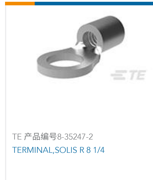
TE 产品编号8-35247-2 TERMINAL,SOLIS R 8 1/4