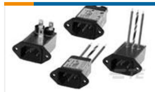
TE 产品编号6609017-9 6EC1=F7284 S0