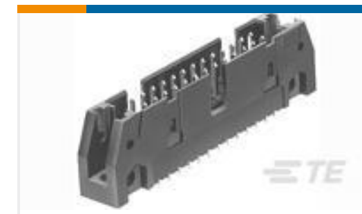
TE 产品编号5102156-5 A/L UNIV HDR 24P VERT