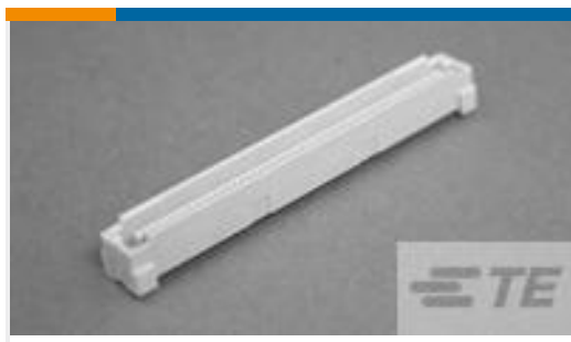
TE 产品编号5179029-4 0.8FH,P06H.5,100,08/Sn,TU