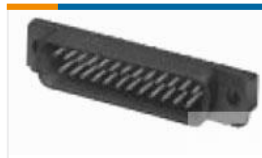
TE 产品编号745072-4 15 PLUG SP/AP SCRLK