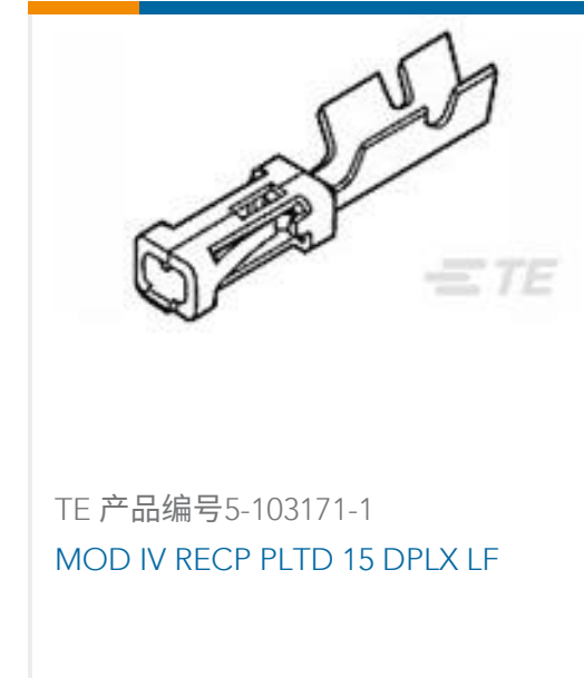
TE 产品编号5-103171-1 MOD IV RECP PLTD 15 DPLX LF