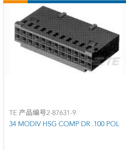
TE 产品编号2-87631-9 34 MODIV HSG COMP DR .100 POL