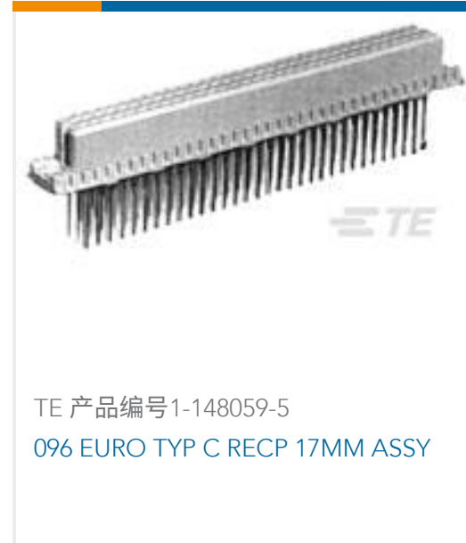
TE 产品编号1-148059-5 096 EURO TYP C RECP 17MM ASSY