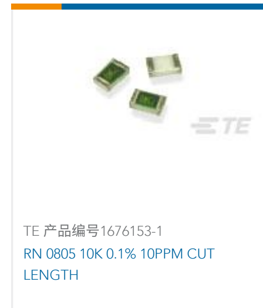
TE 产品编号1676153-1 RN 0805 10K 0.1% 10PPM CUT LENGTH