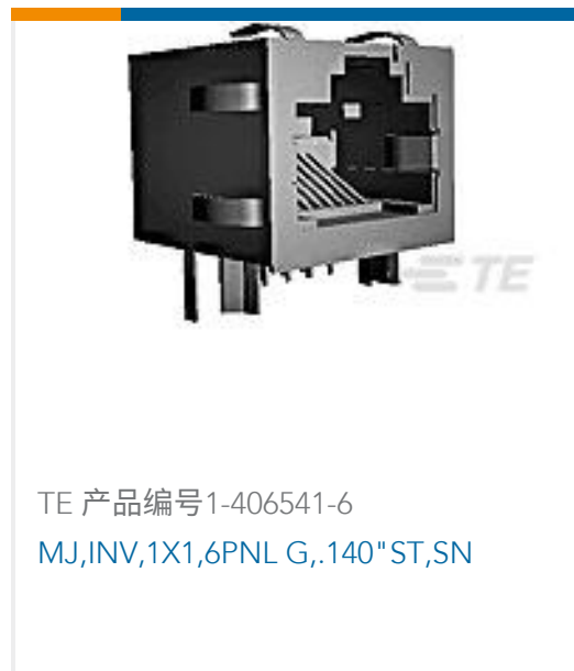
TE 产品编号1-406541-6 MJ,INV,1X1,6PNL G.,140"ST,SN