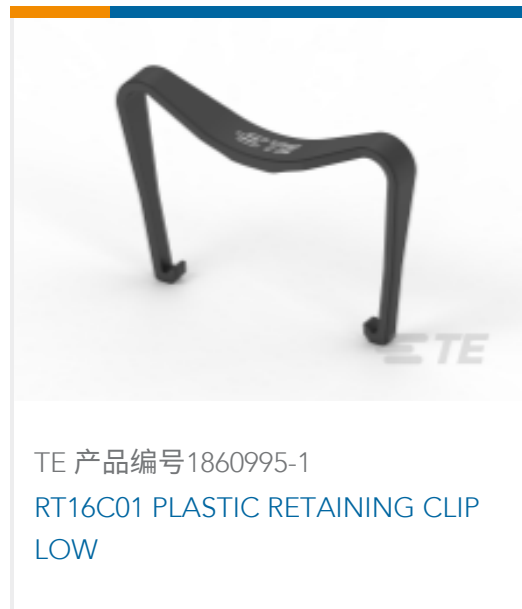
TE 产品编号1860995-1 RT16C01 PLASTIC RETAINING CLIP LOW