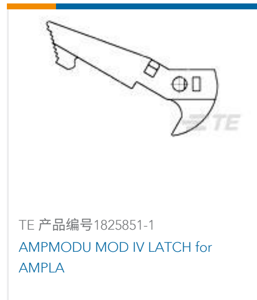
TE 产品编号1825851-1 AMPMODU MOD IV LATCH for AMPLA