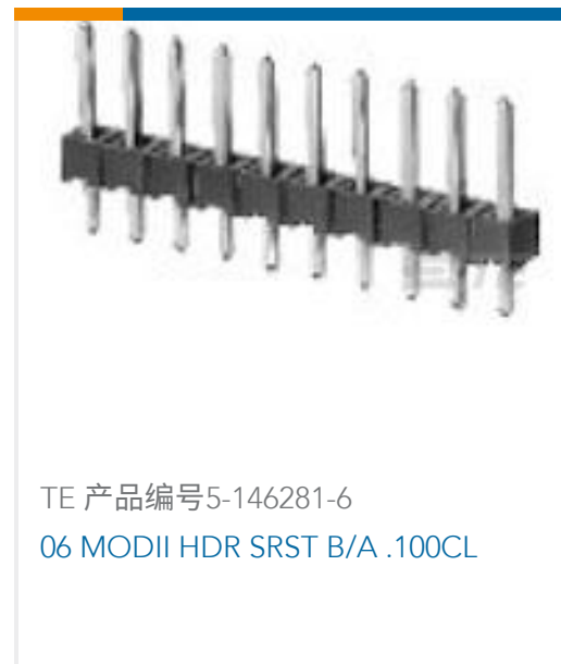
TE 产品编号5-146281-6 06 MODII HDR SRST B/A .100CL