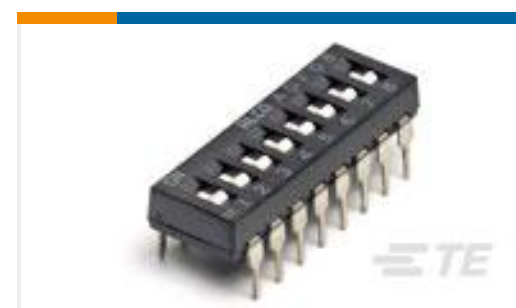
TE 产品编号1825002-5 ADF0404=DIP SWT,FLUSH,THRU/HL