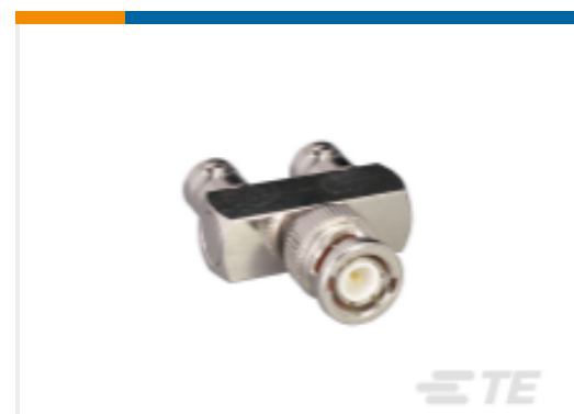
TE 产品编号ADP-BNCM-BNCF-T-2 BNC Plug to BNC Jack (2) Tee