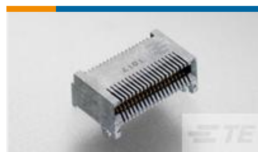
TE 产品编号2110819-1 QSFP+ Enh EVERCLEAR PT Conn