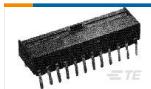
TE 产品编号280581-2 MOD II SGL ROW 15P REC. ASSY HMT, Au