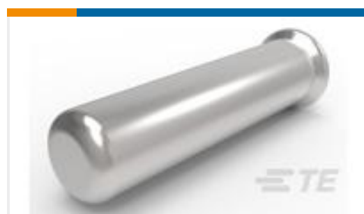
TE 产品编号50462-6 SOCKET,MIN-SPR AU SER-2