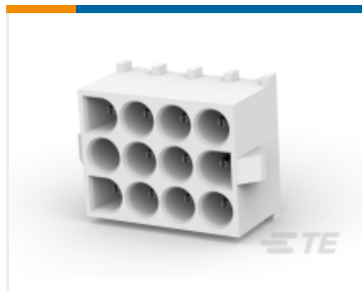
TE 产品编号1586681-2 12P UMNL PIN HDR ASSY 94VO omit #2