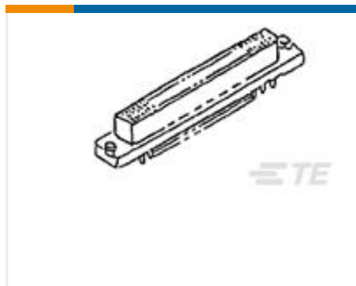
TE 产品编号5174215-4 AMPLIMITE.050 PLUG ASS'Y (V) 60P PB-FREE