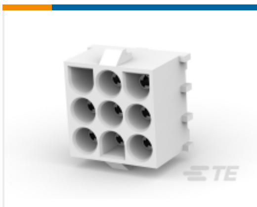
TE 产品编号1586682-3 09P UMNL HDR ASSY PC 94VO SL