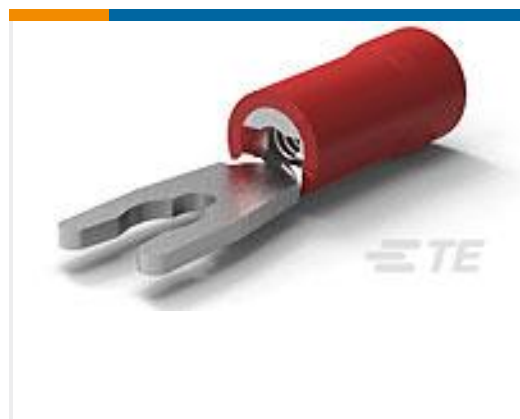
TE 产品编号8-52947-1 PG SP SPD 22-16COMM 22-18MIL 4