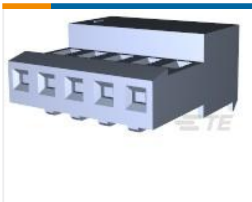
TE 产品编号3-641192-5 05P MTA100 CONN ASSY BLU LF