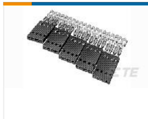
TE 产品编号103975-6 2X7 MTE RCPT SR PLAIN .100CL #2