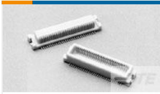
TE 产品编号5-1747022-3 ON TAPING(EMBOSS) 0.5MM PITCH