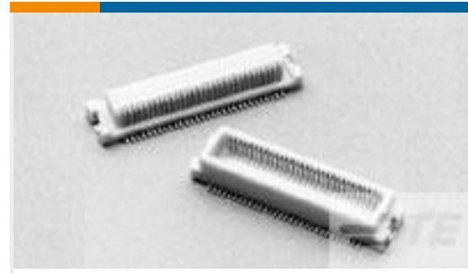
TE 产品编号5-1747257-3 ON TAPING(EMBOSS)0.5 FINE MATE