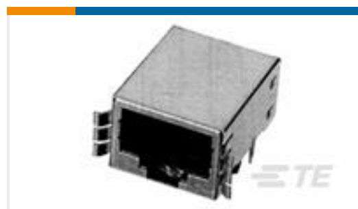
TE 产品编号1116062-2 MJ,10MM,8P,BEZEL PNL TABS,SN