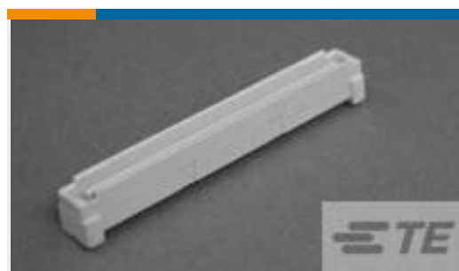
TE 产品编号2-5177986-2 0.8FH,P07H.5,060,08/Sn,TR,SC