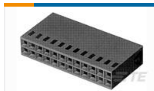
TE 产品编号1-87456-3 18 MODIV HSG COMP DR .100CL