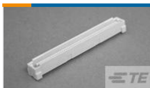
TE 产品编号 5179029-1 0.8FH,P06H.5,040,08/Sn,TU