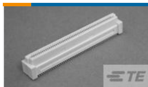
TE 产品编号5-5179180-2 0.8FH,R09H.5,060,08/Sn,TR,SC