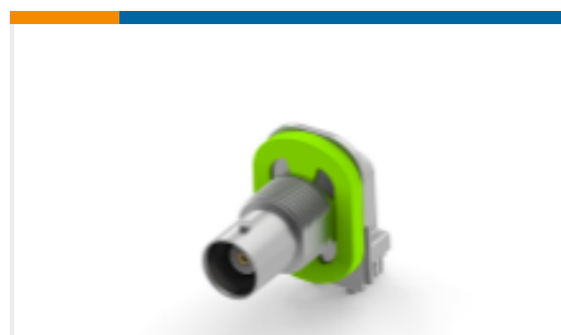
TE 产品编号2016166-1 JACK, R/A PCB, 50 OHM, BNC