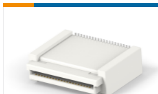
TE 产品编号2271041-1 0.8FH,R19H.5,040,30/SN,TR,SC