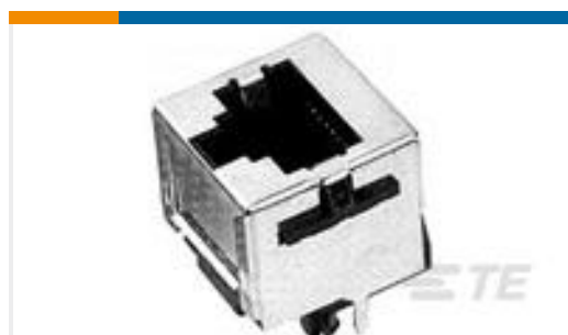
TE 产品编号1734577-3 MOD-JK,8P8C,SHD W/LED, G/Y,30U"