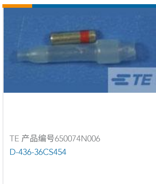
TE 产品编号650074N006 D-436-36CS454