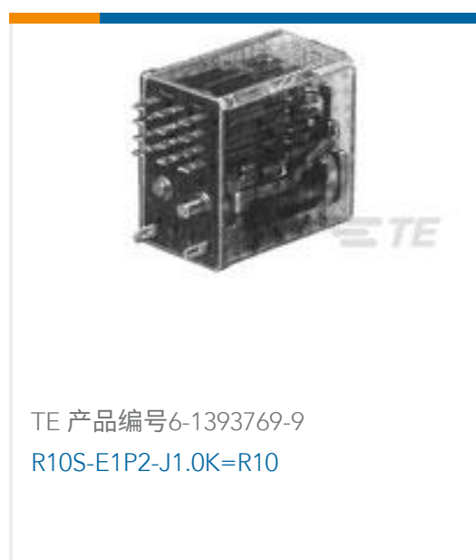
TE 产品编号6-1393769-9 R10S-E1P2-J1.0K=R10