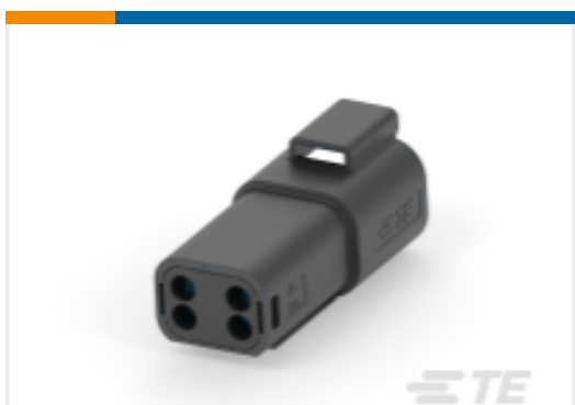
TE 产品编号1-2600030-0 4CCT BLACK RECEP W/LARGE SEAL