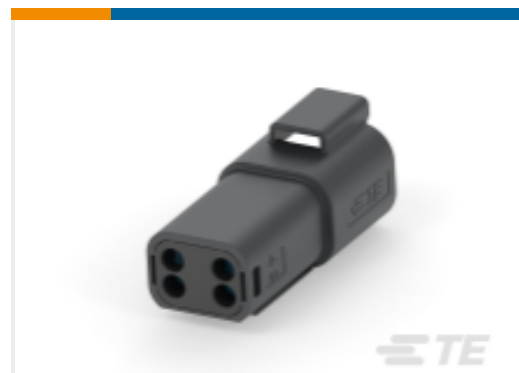
TE 产品编号1-2600030-0 4CCT BLACK RECEP W/LARGE SEAL