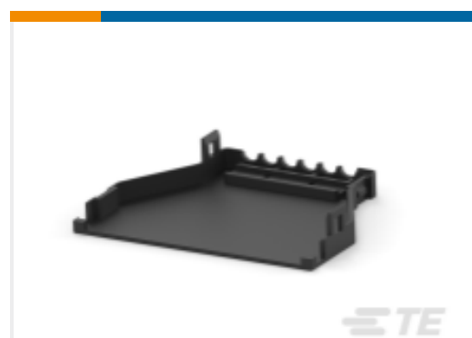
TE 产品编号1776695-1 Strain Relief, D5200, Dynamic