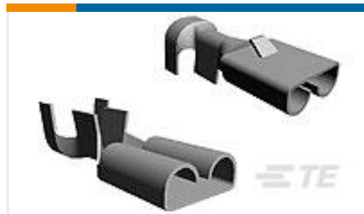
TE 产品编号180351-2 FF 250 REC 4-6MM2 PTBR