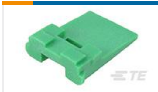
TE 产品编号W2P WEDGE LOCK, 2P, REC, GRN, DT