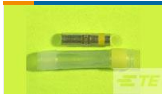
TE 产品编号650075-000 D-436-37