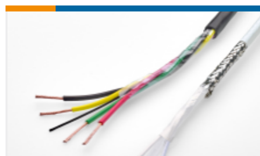
TE 产品编号CW9557-000 CBS-24CN21-21M-9