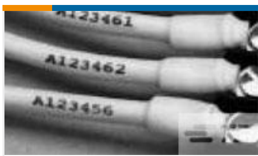
TE 产品编号5070124008 RNF-100-2-X-SP