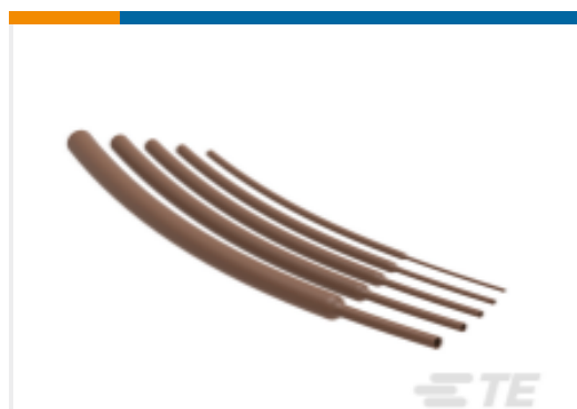
TE 产品编号5053314033 RNF-100-1 热缩管