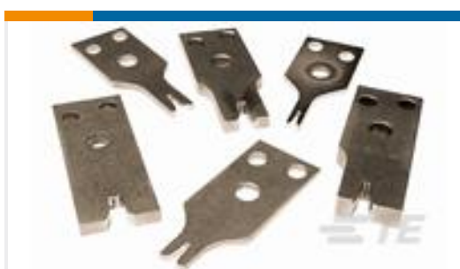
TE 产品编号6-683454-5 CRIMPER, INSULATION, "O"