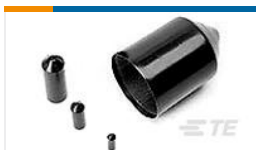
TE 产品编号025307-000 101A083-100-0