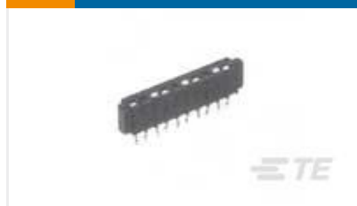
TE 产品编号5-520315-5 TRIOMATE ASSY V 5P L=3.556LDFR