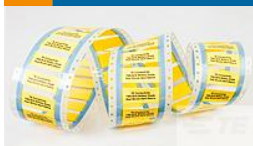
TE 产品编号6315830001 TMS-SCE-3/4-2.0-4