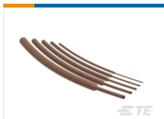
TE 产品编号5070112026 RNF-100-X 热缩管