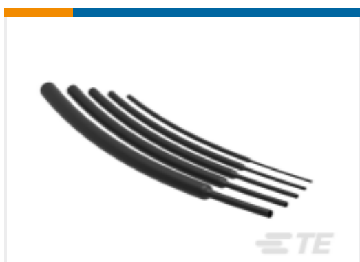
TE 产品编号5053192058 RNF-100-0 热缩管