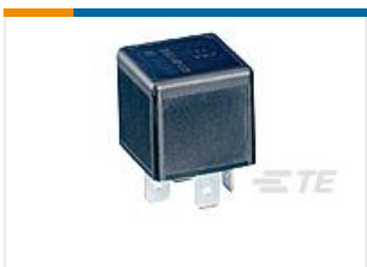
TE 产品编号7-1393304-1 V23134M1052C642-EV-CBOX