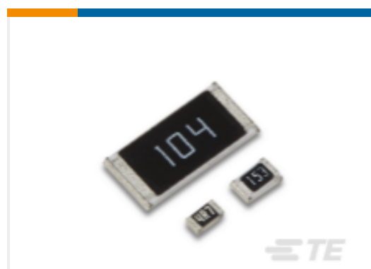
TE 产品编号5-2176341-4 CRGCQ 0805 270K 1%