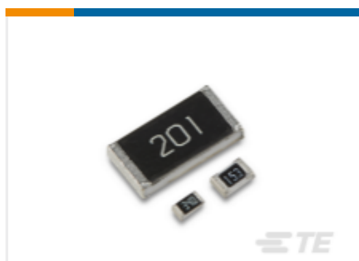
TE 产品编号2176330-5 CRGP 2010 22R 1%