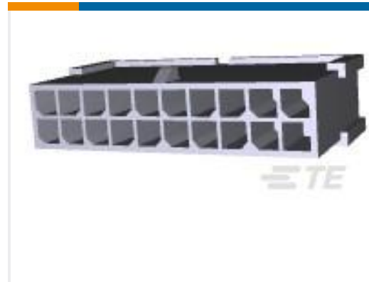
TE 产品编号2-794616-0 FREE HANG DBL ROW HSG 20 POS