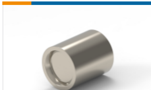
TE 产品编号136311-2 TERM, PRL SPL, STRAT, SOLIS, HR, 6