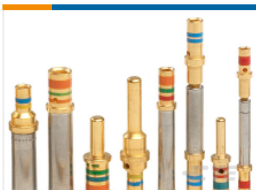
TE 产品编号109028-31 CONT PIN