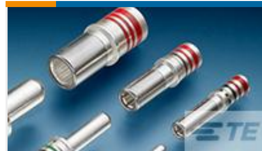
TE 产品编号0662-207-0482 CONT SOC ASSY