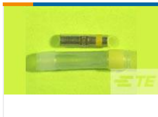
TE 产品编号650099-000 D-436-76