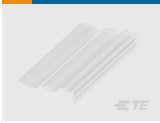
TE 产品编号NB15524001 RNF-100-CL 热缩管