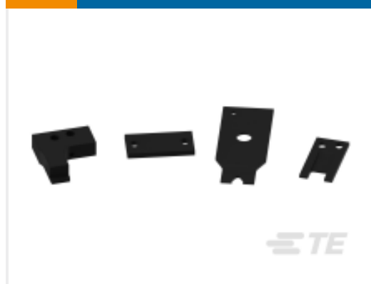
TE 产品编号2280112-2 BLADE, SHEAR