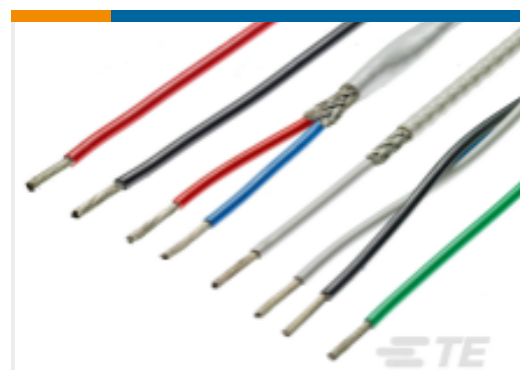
TE 产品编号6576693001 99M0111-20-92