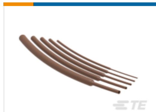
TE 产品编号5070022021 RNF-100-X 热缩管