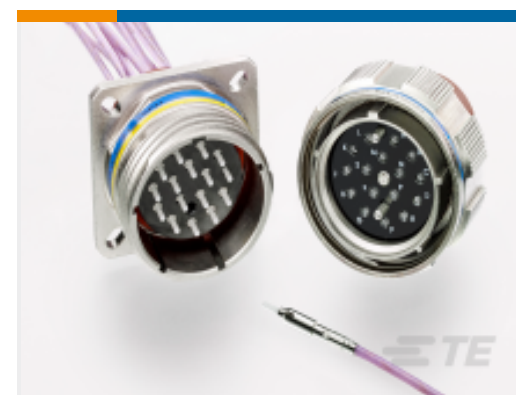
TE 产品编号YMC8016-Z-21-16SN0 ARINC 801, TYPE 1 PLUG CONNECTOR