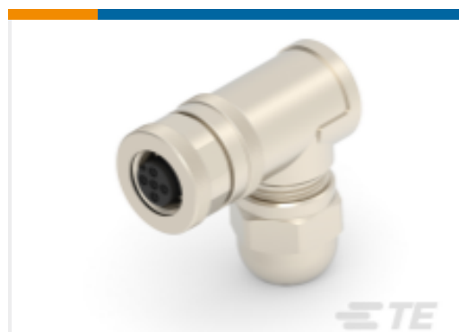
TE 产品编号T4112011031-000 M12 F, 3P GOLD A_CODE RA SHIELDED PG7