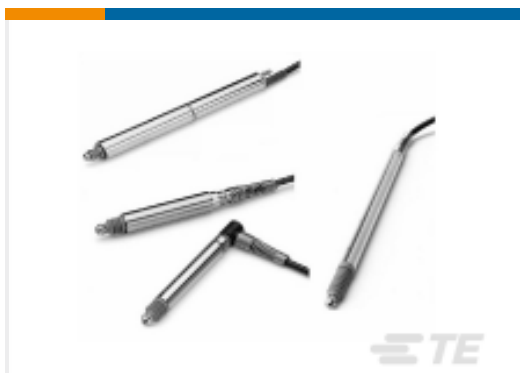
TE 产品编号02350679-000 GA-HD LBB-375-PA-100A