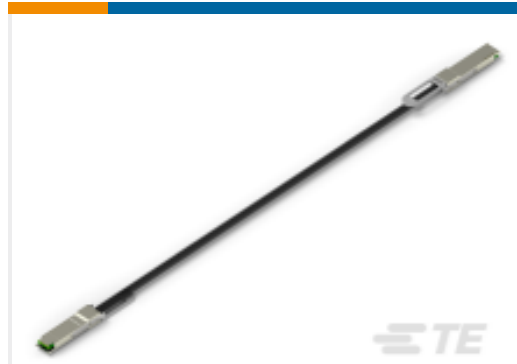
TE 产品编号2333393-7 QSFP 25GIG 30AWG 3 METER