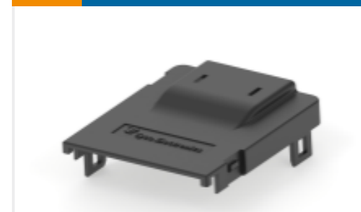
TE 产品编号1986186-1 Strain Relief,20 Posn,D3000 Dynamic, 2