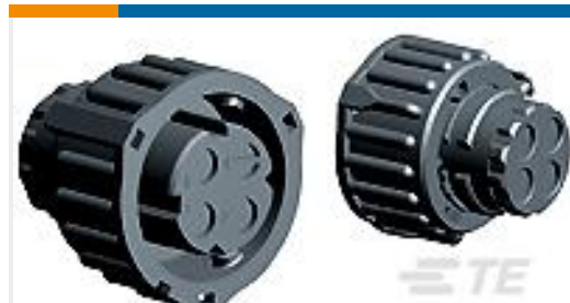
TE 产品编号3-1719434-2 4 POS DIA 2.5 SOCKET CONNECTOR HSG