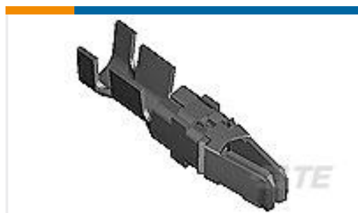
TE 产品编号2-66741-0 TYPE XII FEMALE CONTACT