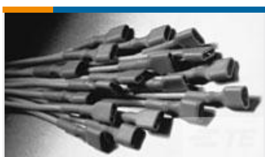
TE 产品编号4847056005 LSTT-12.7-0-50MM