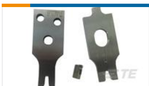
TE 产品编号7-2151803-7 OCEAN_2.0_SPARE_PART_KIT-066F090OV