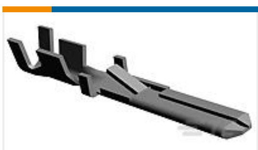
TE 产品编号964132-2 FF 110 TAB 0.5-1.0 MM2 PTP CUSN4