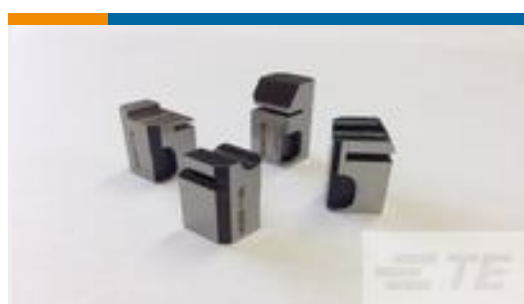
TE 产品编号1633861-3 FLOATING SHEAR