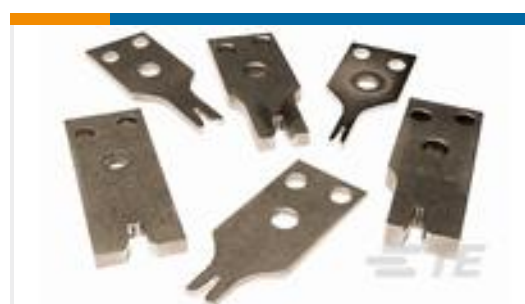
TE 产品编号1-1803019-1 CRIMPER, INSULATION O