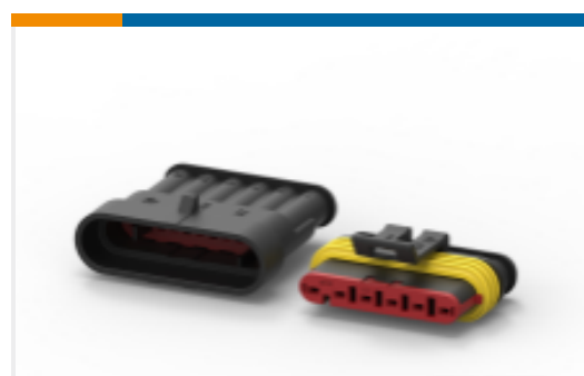
TE 产品编号282104-1 AMP SUPERSEAL 1.5MM, 连接器壳体