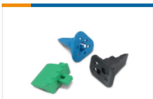
TE 产品编号W2S Wedgelocks: DEUTSCH DT