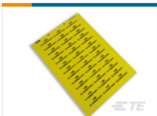
TE 产品编号5-1768033-5 LEB-0916P-4