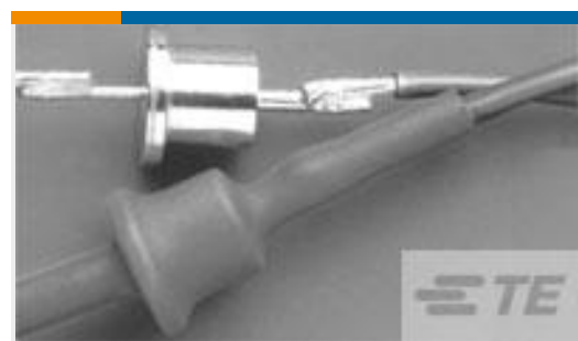
TE 产品编号9148734001 RNF-3000-18/6-9-SP