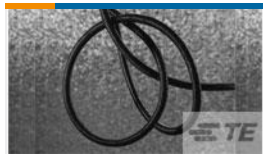
TE 产品编号5470244007 CONVOLEX-1/2-0-SP