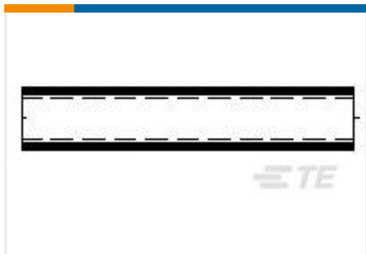
TE 产品编号010951-000 AT099-35