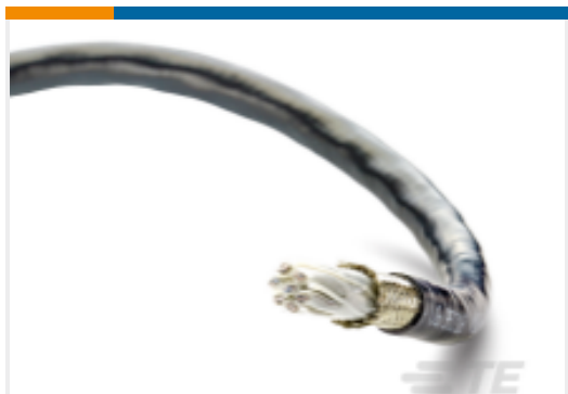
TE 产品编号7787473001 VG-95218-T028-D013CK3100