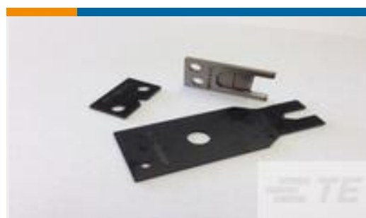
TE 产品编号4-690474-1 BLADE, SLUG