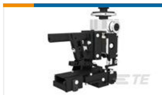
TE 产品编号2151893-1 OCEAN_2.0_APPPLICATOR-S-070F100F-RSM