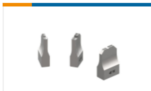
TE 产品编号2-1633921-6 ANVIL, COMBINATION