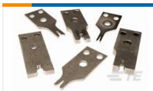
TE 产品编号3-459736-4 CRIMPER, WIRE "F" SPLICE TYPE