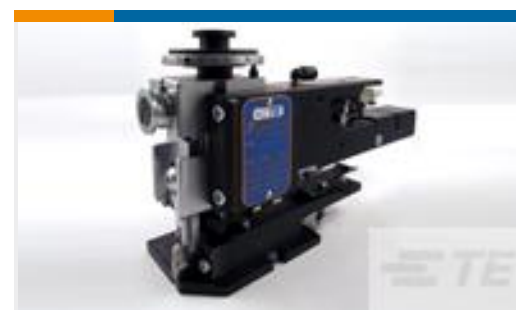
TE 产品编号2150072-2 OCEAN_2.0_Applicator-E-055F080F-REA