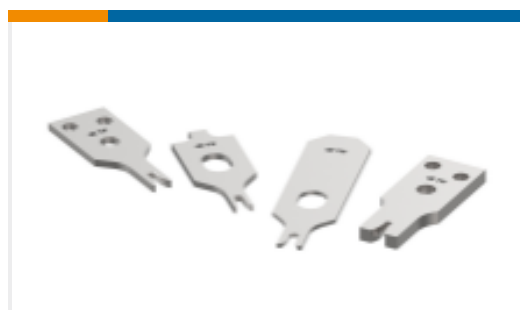
TE 产品编号1803101-8 CRIMPER, INSUL OVERLAP PREM