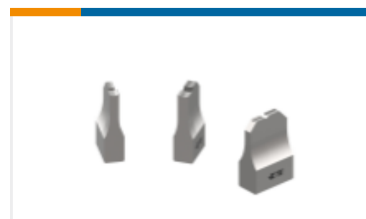
TE 产品编号8-690618-0 ANVIL, SPLICE TYPE