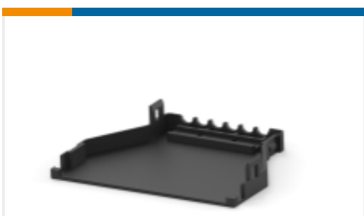
TE 产品编号1776695-1 Strain Relief, D5200, Dynamic