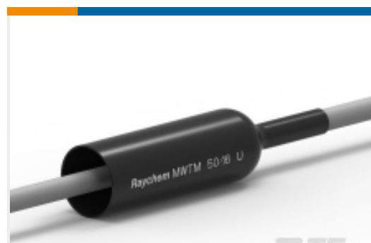
TE 产品编号663016-000 中厚壁热缩管