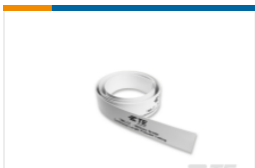
TE 产品编号EL7662-000 TMS-CT-50M-3/16-OUT-9