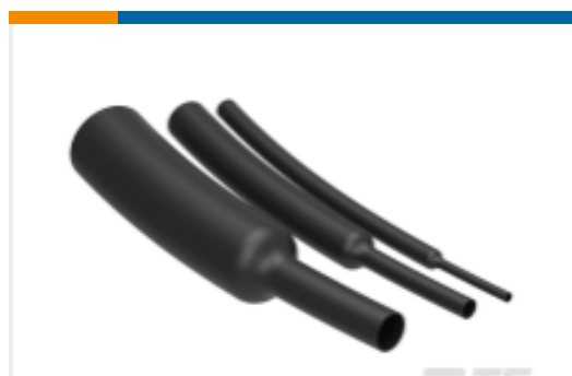
TE 产品编号5067124001 CGPT 2:1 热缩管