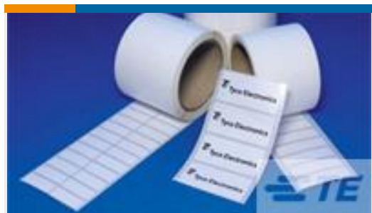
TE 产品编号8-1768018-1 EET-2570P-9