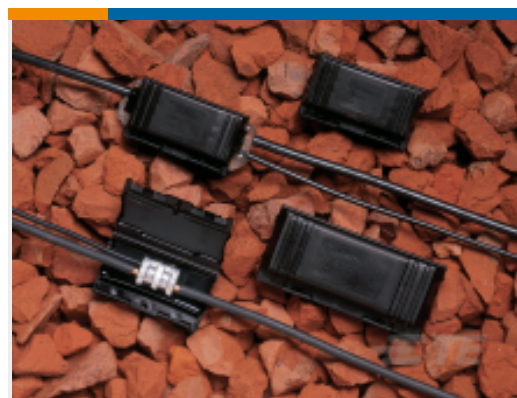
TE 产品编号 C48562-000 GHFC-2.5-90(B300)