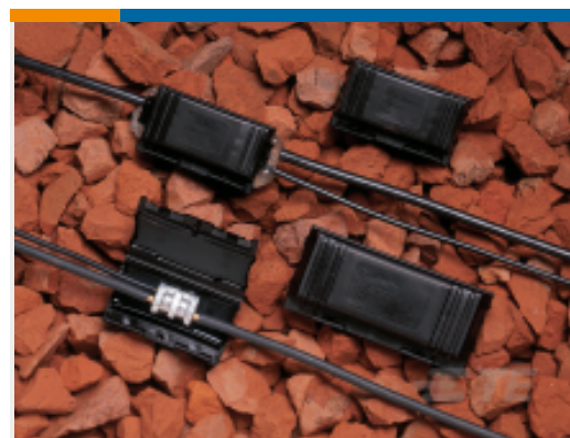
TE 产品编号 765669-000 GHFC-1-90(B10)