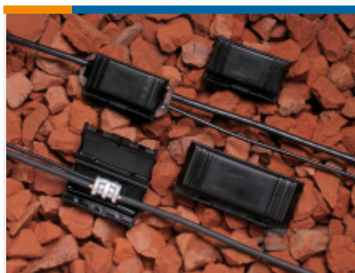
TE 产品编号 166533-000 GHFC-1-90(B100)