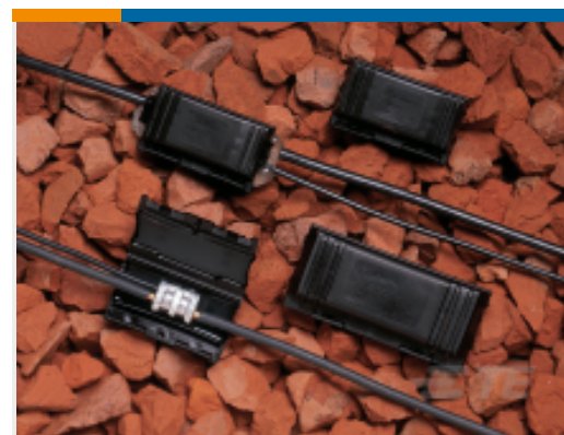
TE 产品编号 294925-000 GHFC-2-90(B10)