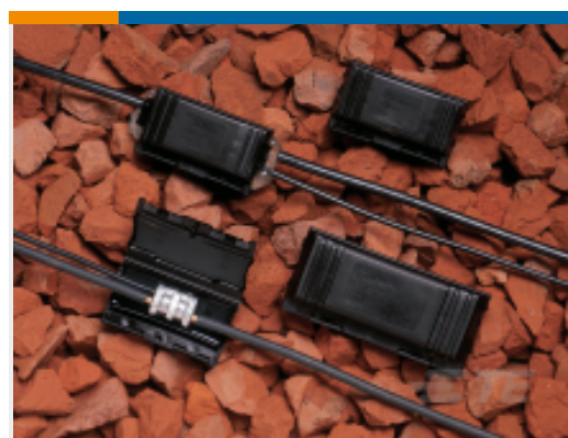
TE 产品编号 629995-000 GHFC-3-90(B18)