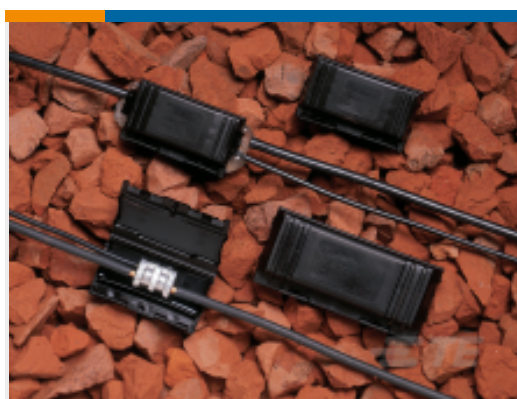
TE 产品编号 348333-000 GHFC-2-90(B100)