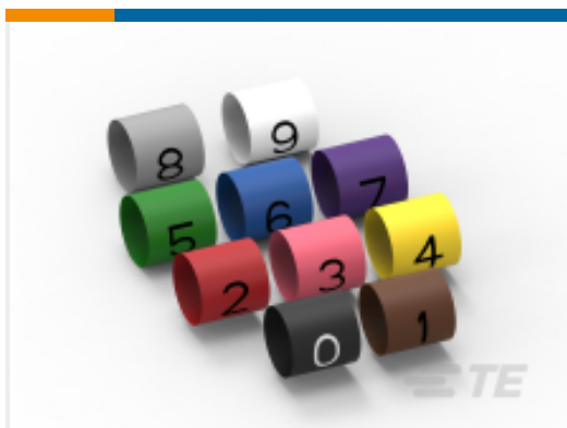
TE 产品编号5059080056 TRSA 热缩管