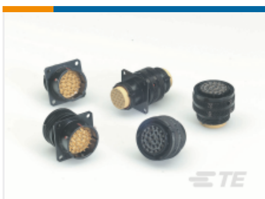
TE 产品编号ZPF000000000018642 FDPA 50-8-33 PN-K 090