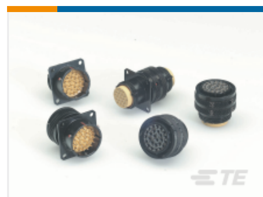
TE 产品编号ZPF000000000018696 FDPA 50-8-98 PN-K-A246