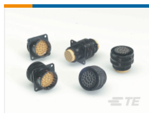
TE 产品编号ZPF00000000018992 FDBA 54-20-16 PN-K-A1198