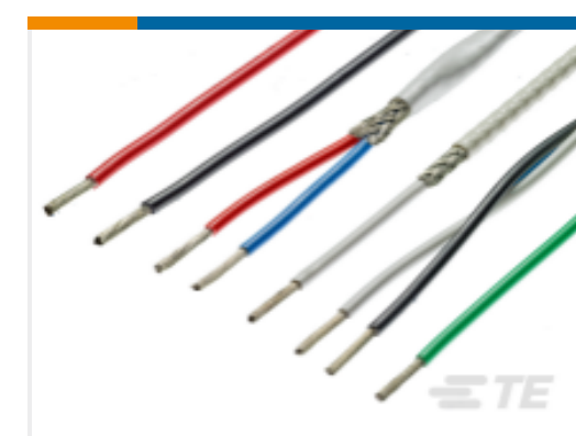
TE 产品编号3840473001 44A0121-24-2/4