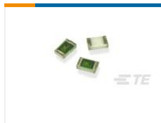
TE 产品编号1-1879129-3 RN 0402 1K33 0.1% 10PPM CUT LENGTH