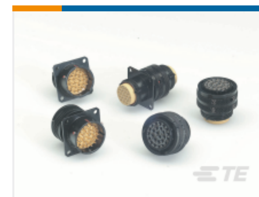
TE 产品编号ZPF00000000018849 FDBA 54-12-10 PN-K-A1198