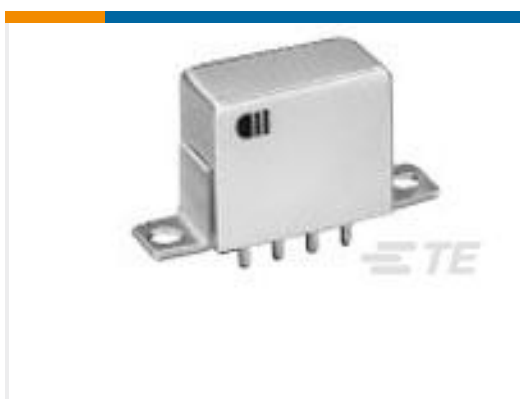
TE 产品编号4-1617001-1 A07B332AC1 = A07 10AMP FULL SI