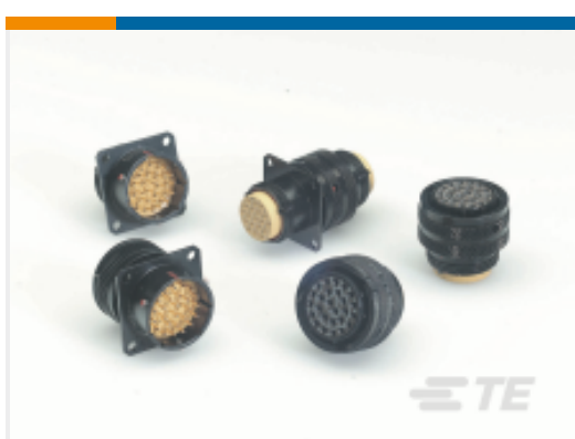
TE 产品编号ZPF00000000018968 FDBA 54-18-11 SW-K-A1198