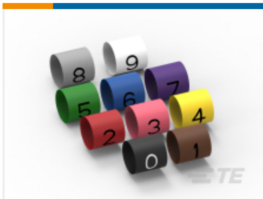
TE 产品编号5059070009 TRSA 热缩管