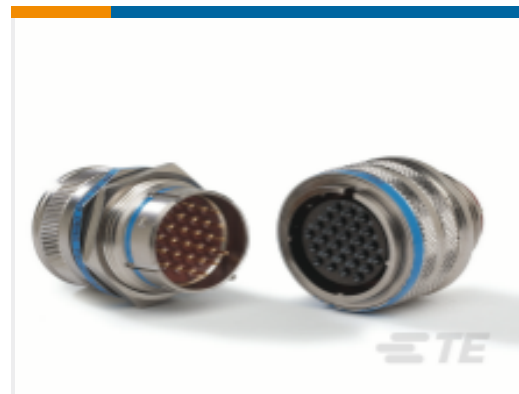
TE 产品编号ZPF00000000013804 DBAS 78-19-7 SN 059