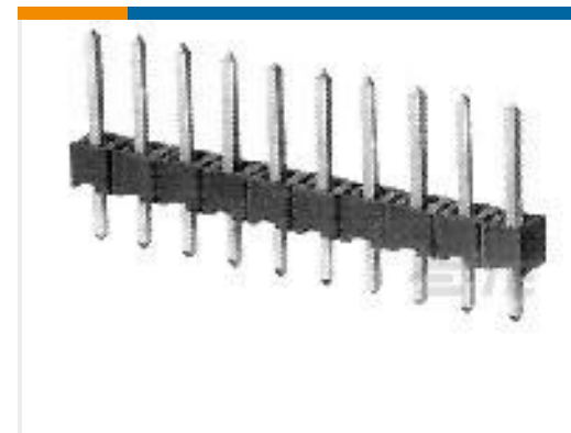
TE 产品编号1-825433-0 MOD 2 PINHDR 1X10P.