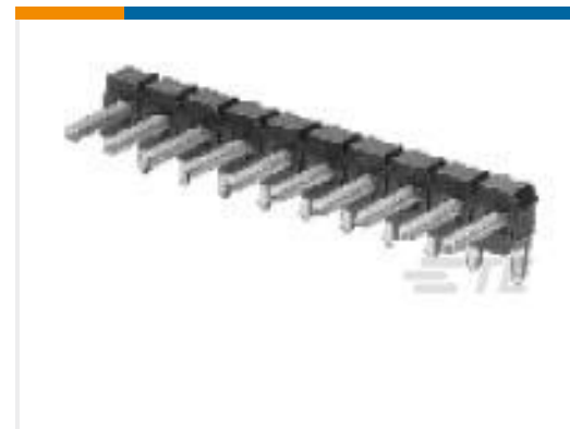
TE 产品编号825437-2 MOD 2 PINHDR 1X02P.