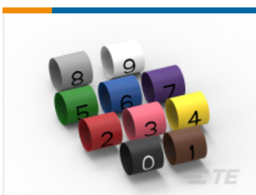
TE 产品编号1607880001 TRSA-1016/C/1/6